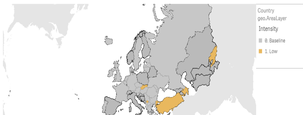
Intensity of influenza activity (EU layout map), 2021-W44