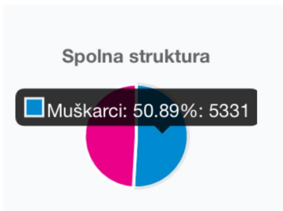
Grafikon 2. Spolna struktura potvrđenih slučajeva, Federacija BiH 21.8.2020.

Spolna struktura potvrđenih slučajeva je ravnomjerno raspoređena, muški spol činio je 50,89% (5331 slučaja).