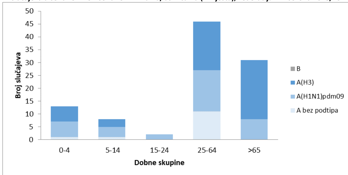
Grafikon 3. Distribucija tipova i podtipova virusa gripe prema dobnim skupinama, kod hospitaliziranih slučajeva u sentinel i non-sentinel klinikama/bolnicama (7 mjesta), Federacija BiH sezona 2018/19.

Ukupno, u sezoni gripe 2018/19 registrirano je devet smrtnih ishoda kod kojih je potvrđen virus gripe A, i to: podtip A(H3) kod 3 slučaja, podtip A(H1N1)pdm09 kod 4 slučaja, a kod dva slučaja nije urađena subtipizacija. Četiri slučaja registrirana su u Kantonu Sarajevo, tri slučaja u Tuzlanskom kantonu i dva slučaja u Hercegovačko-neretvanskom kantonu.